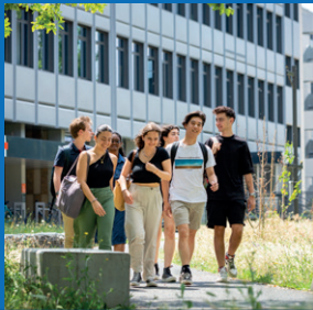
CAMPUS DE LA DOUA – INSA LYON (VILLEURBANNE)

Un cadre urbain au cœur de la métropole lyonnaise, avec plus de 3 100 places en résidences étudiantes, une offre de restauration variée, 120 associations et de nombreuses infrastructures sportives et culturelles.