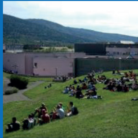
CAMPUS D'OYONNAX – INSA LYON

Un cadre urbain au cœur de la métropole lyonnaise, avec plus de 3 100 places en résidences étudiantes, une offre de restauration variée, 120 associations et de nombreuses infrastructures sportives et culturelles.