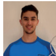
1/ François Gabart, vainqueur du Vendée Globe 2013